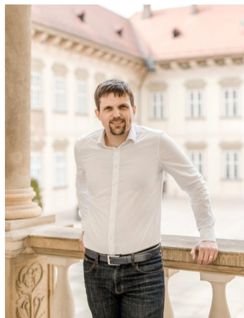
Mgr. Petr Hladík 1. náměstek primátorky města Brna předseda Řídícího výboru MAP Brno

Při Dni náborů na Kraví hoře se budou v sobotu 4. září prezentovat jednotlivé sportovní kluby. Děti a mládež si řadu aktivit také přímo vyzkoušejí. V loňském roce si akci nenechalo ujít téměř 6 tisíc lidí a věřím, že i letos se tu setkáme s množstvím návštěvníků. Chceme touto formou přilákat co nejvíce děti a mládeže ke sportování a zároveň podpořit rozšiřování členské základny sportovních klubů. Letos má pořádající městská společnost STAREZ–SPORT potvrzenou účast 114 klubů , které se zaměřují na více než 50 sportovních odvětví. V neděli 5. září se pak uskuteční Den sportu ve sportovním areálu na Vodově v Králově Poli. Na návštěvníky zde budou čekat vedle rozmanitých sportů a her také soutěže o ceny a mnoho dalšího.